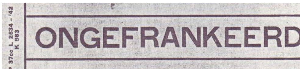
strook, model P 37CC

Het bleek dat met de vermelding van de term "ONGEFrankeerd" boven het adres zeer onzorgvuldig werd omgegaan. Het woord "ongefrankeerd" werd of op een onopvallende plaats vermeld of ontbrak zelfs helemaal. Daarom werd in juli 1934 de oranjeleurige strook, model P 37CC, met het opschrift "ONGEFrankeerd" ingevoerd.